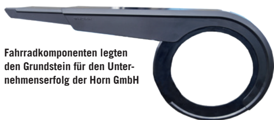
Fahrradkomponenten legten den Grundstein für den Unternehmenserfolg der Horn GmbH