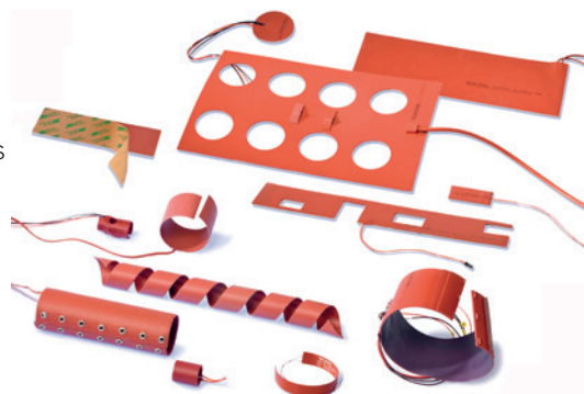
Flexible Heizungslösungen aus Silikon prägen heute das Selbstverständnis als Heizungsspezialist